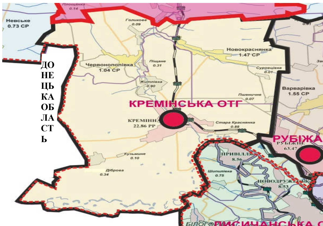
Рис. 2.1. Адміністративна карта Кременської ОТГ