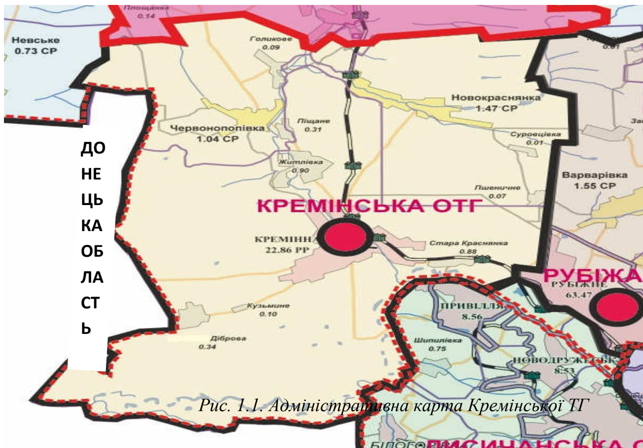
Рис. 1.1. Адміністративна карта Кременської ТГ

Кременська ТГ розташована на заході Луганської області та межує з Донецькою областю.